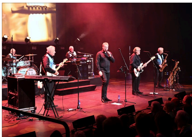
STEMNING: Det var god stemning fra første sang da Ole Ivars spilte på musikkteateret lørdag kveld.