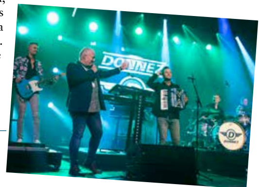
Ifølge dansebandveteranen Erik Forfod er Donnez neste generasjon av danseband. – Følg med på dem fremover, oppfordrer Forfod.

– Folk bryr seg ikke så mye om det er en svensk, norsk eller dansk tekst. Det er den spesifikke teksten eller låta, som betyr noe for folk, ikke hvilket språk den fremføres på. Og så betyr det mye for folk å samles, danse og hygge seg.