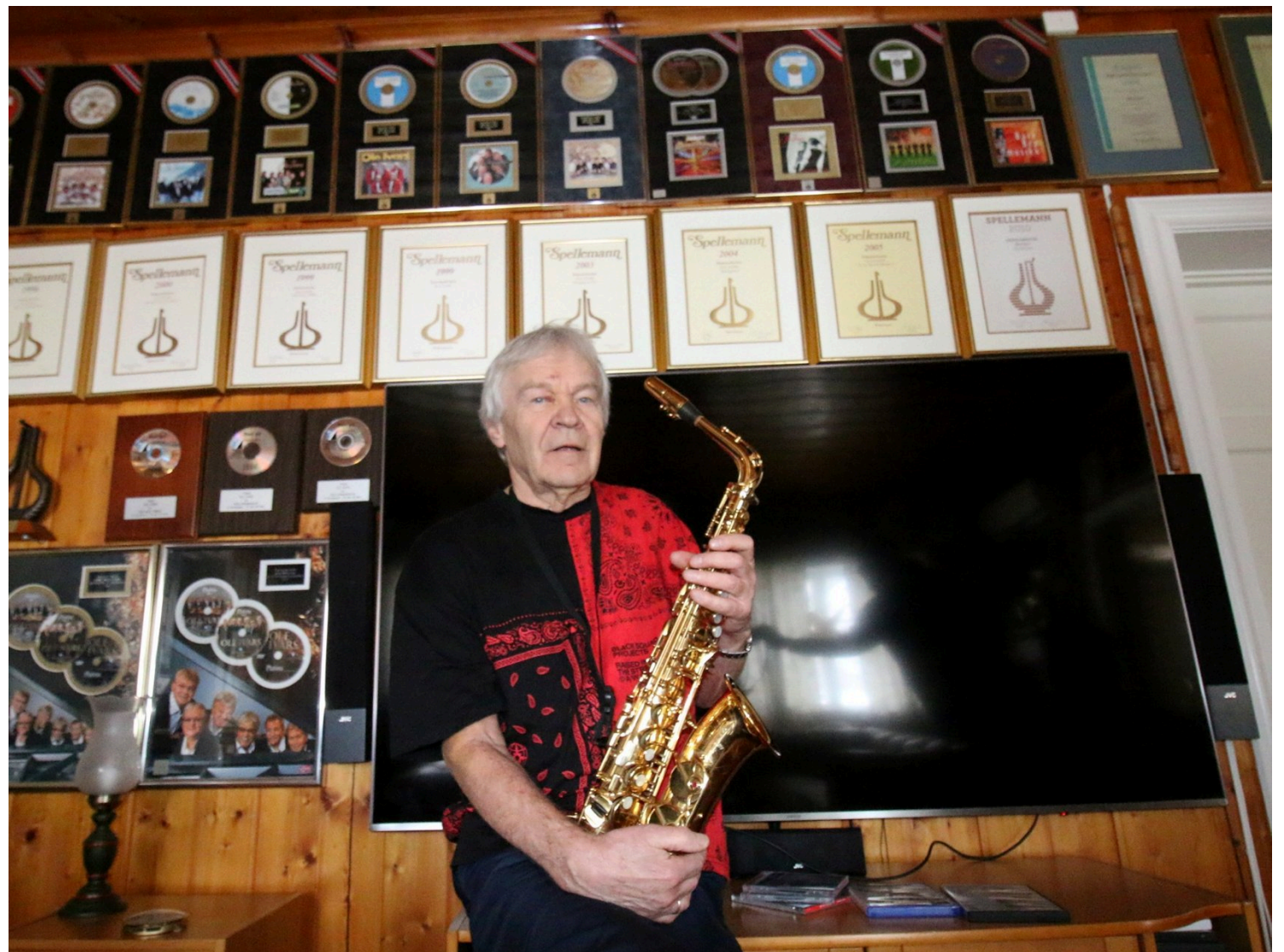
SISTE KONSERT: Arne Willy Foss og resten av Ole Ivars annonserer at de holder sin siste konsert lørdag 19. oktober. Norges største danseband spiller da i Oslo Spektrum. Bak Arne Willy henger noen av de mange gullplatene og Spellemannsprisene dansebandet har fått.

- Stort sett har vi spilt opp til dans, men nå blir det en konsert. Det skal noe til å fylle salen, men vi håper jo på det da. De som kommer på en slik kveld for å