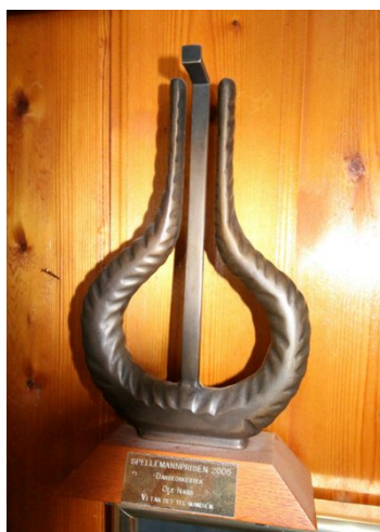
SPELLEMANNSPRIS: Ole Ivars har fått hele åtte Spellemannspriser.